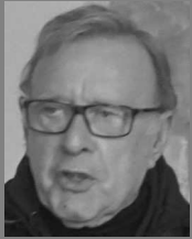
Lycée de Sillac